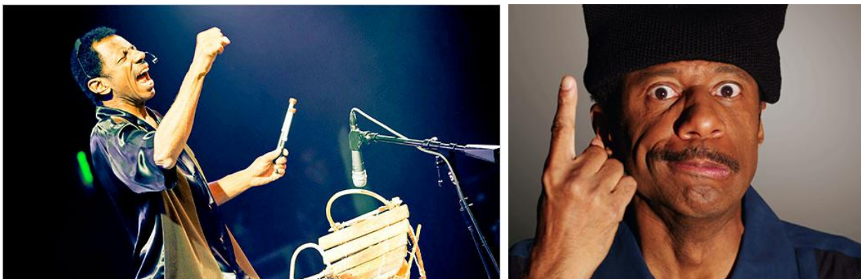
Snímek Podívej se, co říkám (See What I'm Saying) nabízí pohled do zákulisí neslyšících hudebníků i herců.

Ke zmiňovaným filmům patří zejména celosvětově oceňovaný snímek Podívej se, co říkám , nabízející ucelený pohled do zákulisí neslyšících umělců, dále australský dokument o životě neslyšících teenagerů s názvem Vítejte v mém hluchém světě či dokument o beduínské vesnici Nerušené ticho , jejímiž obyvateli jsou pouze neslyšící. Jedním z důležitých hostů tohoto bloku bude Věra Strnadová , autorka knih Jaké je to neslyšet či Dorozumívání s neslyšícím pacientem , jež se mj. zasloužila o založení České unie neslyšících.