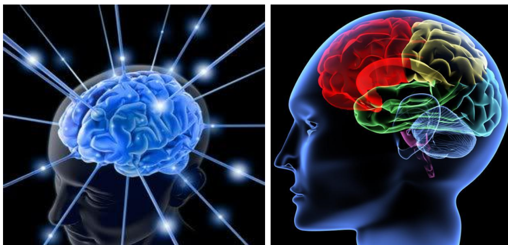
Na festivalu se mj. představí snímek My Brilliant Brain z produkce National Geographic

Více vidět, více vědět. Platí to i v případě mozku. Díky unikátnímu programovému bloku budou mít diváci možnost proniknout do tajů tohoto fascinujícího orgánu. Za posledních dvacet let ostatně poznání mozku prodělalo zcela zásadní revoluci. Vědci mají konečně možnost důkladně sledovat mozek při jeho obvyklé práci, během výkonu jednotlivých operací. Pomocí pokročilého zkoumání mozku mohou získat nové poznatky o fungování lidských emocí, myšlení, paměti atd. Zásadní programový blok AFO 46 nejenom, že poukáže na úchvatné objevy na poli výzkumu mozku, ale odkryje jeho skrytý potenciál a zejména tento jedinečný lidský orgán představí z hlediska jeho vývoje od dětství až po dospělost. Tahákem pro diváky budou jak rozmanité dokumenty z produkce Discovery Channel nebo National Geographic , tak například přednáška o neuromarketingu v podání Josefa Vojty , předního českého odborníka na dané téma. Vojta tento druh marketingu představí jako mladou disciplínu, zkoumající oblast mozku, která určuje naše chování při výběru a nákupu daného produktu, a také napovídající, jakým způsobem si interpretujeme komerční reklamní sdělení.